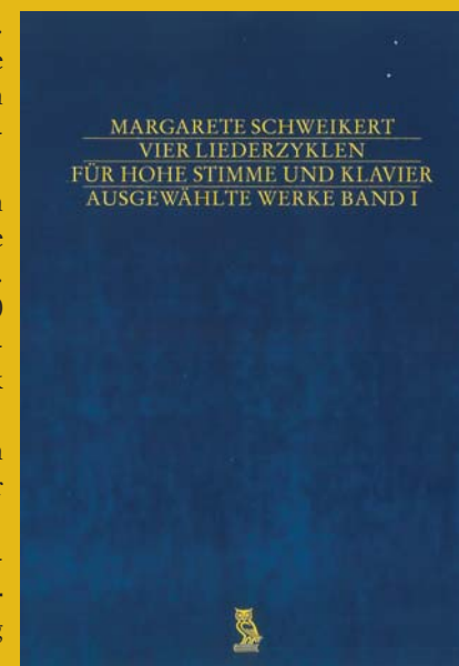
Einband der Ganzleinenbände Cover of the clothbound volumes

Herausgeberin: JEANNETTE LA-DEUR, Karlsruhe